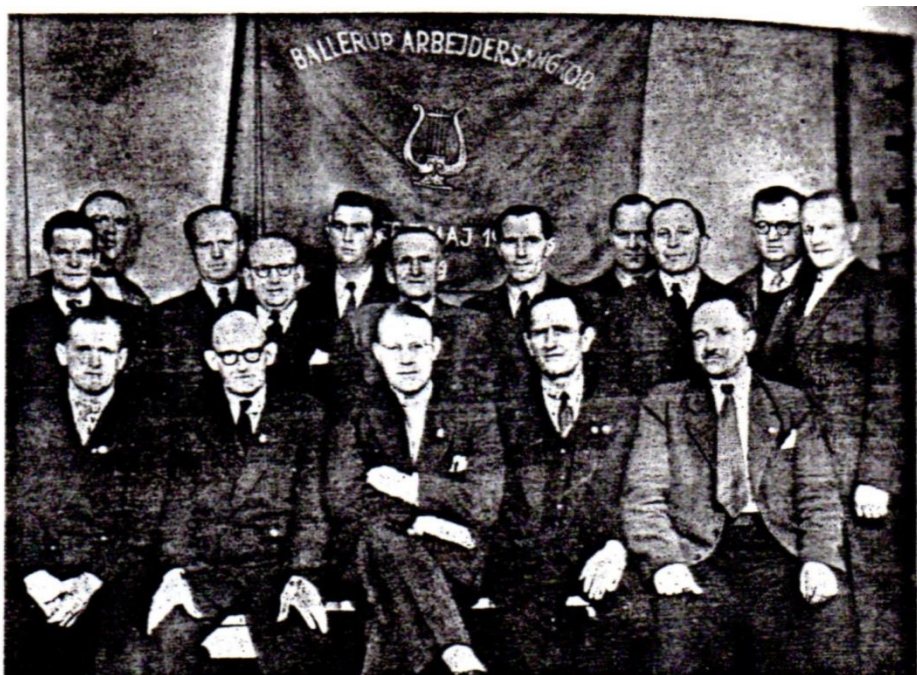
Ballerup Arbejder Sangkor, stiftet 7. maj 1936.

7. maj 1936 stiftes Ballerup Arbejder Sangkor, et mandskor om hvis aktiviteter vi intet ved.